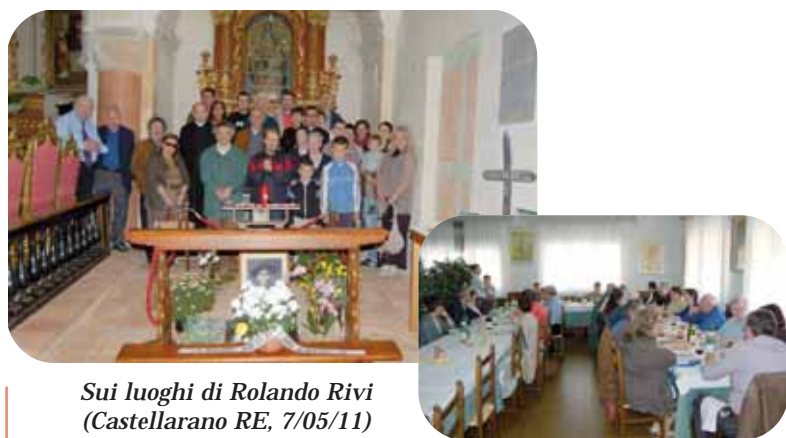
Sui luoghi di Rolando Rivi (Castellarano RE, 7/05/11)

sulla tomba di Rolando Rivi seminarista di 14 anni barbaramente ucciso dai partigiani nel 1944. Una quarantina di persone si sono ritrovate sui luoghi e dopo la visita e la preghiera sulla sua tomba, ed un ottimo pranzo in un ristorante della zona, il gruppo si è spostato in mezzo alle montagne di Monchio sul luogo dell'uccisione, dove è stata deposta una corona di fiori vicino alla lapide che ne ricorda il sacrificio.