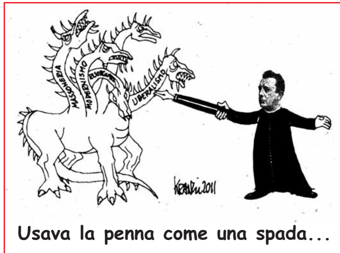
Usava la penna come una spada...

ziativa. Ne ricordiamo la cortesia e l'affabile disponibilità. Raccomandiamo le loro anime alle vostre preghiere.