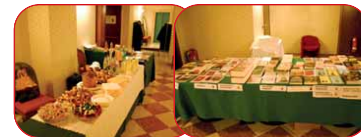
X Convegno di studi albertariani: la sala, il rinfresco, la tavola dei libri, lo Staff organizzatore con la maglietta ricordo del decennale "usava la penna come una spada"